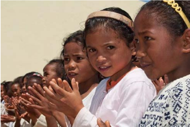
Des enfants du diocèse de Maintirano, à Madagascar, participent à une activité. En 2023, Mission foi a contribué à plus de 6 500$ pour la formation et l'accompagnement des catéchistes.