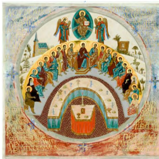
Life in Community , Aidan Hart with contributions from Donald Jackson, © 2002, The Saint John's Bible, Saint John's University, Collegetown, MN, USA. Used by permission. All rights reserved.

* disponible en anglais seulement, selon la New Revised Standard Version que nous utilisons au Canada