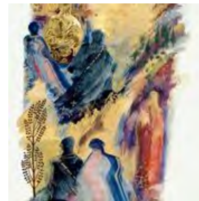
Road to Emmaus , Sally Mae Joseph, © 2002, The Saint John's Bible, Saint John's University, Collegetown, MN USA. Used by permission. All rights reserved.