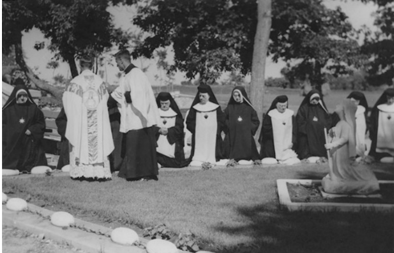
Dévotions mariales au noviciat oblat de Saint-Norbert, en 1952.