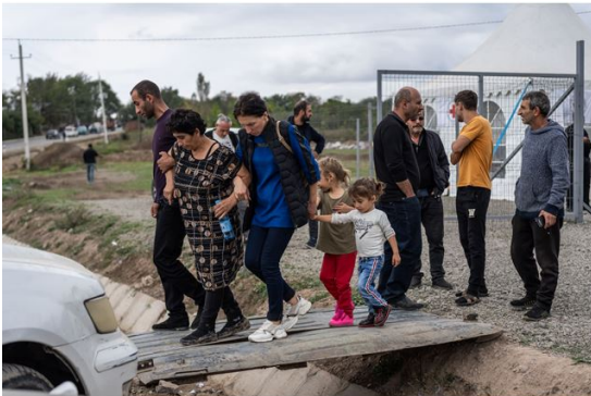
Les habitants du Haut-Karabakh ont été déplacés de force en Arménie, en octobre 2023, à la suite de l'occupation de l'Azerbaïdjan. CNEWA soutient les réfugiés au Moyen-Orient et au Proche-Orient depuis 1926.